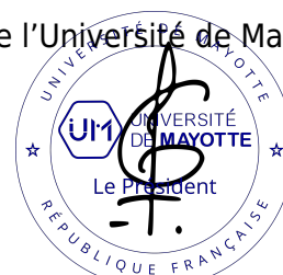
Abal-Kassim CHEIK AHAMED