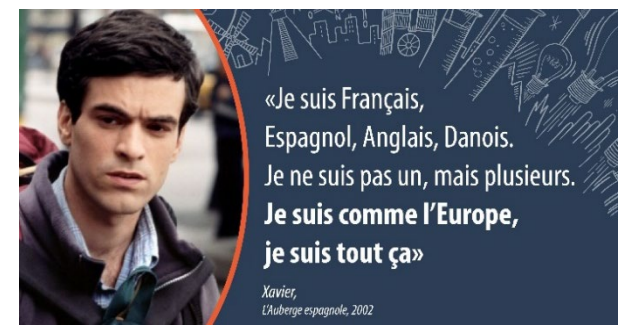
Xavier, L'auberge espagnole, 2002

Les lauréats du défi l'Europe à Mayotte seront annoncés le lundi 15 octobre sur les réseaux sociaux du CUFR et Emanciper Mayotte.